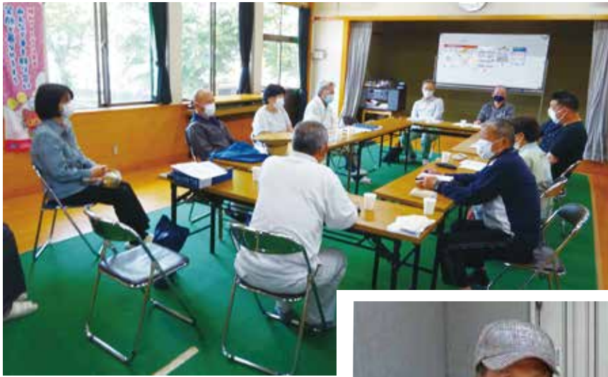
▲新役員会議の様子

発行／編集 社会福祉法人 赤磐市社会福祉協議会 ☎ (086) 955-8777 Fax (086) 955-7788 〒709-0821 岡山県赤磐市河本778-1 ✉ : akaiwashakyo@akaiwashakyo.or.jp ホームページアドレス : http://www.akaiwashakyo.or.jp