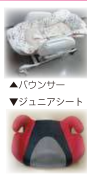
▲バウンサー ▼ジュニアシート