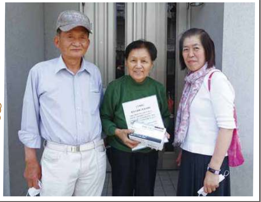
▲福祉推進員と民生委員児童委員で訪問活動 (写真撮影時のみマスクを外しています)