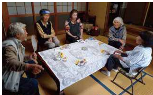
▲困りごと相談会の様子

区長は、今後出てきた困りごとについて特に広域の課題などは、笹岡地区社協でも検討できたら良いと話がされていました。