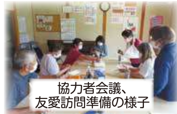
協力者会議、友愛訪問準備の様子