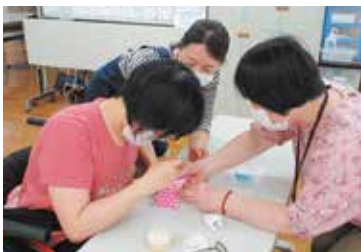
▲あかいわボランティアセンターの手芸ボランティアさんを講師に、初めての手芸教室を開催しました。

地域活動支援センター「ももっこ作業所」では、通所により障がいのあるかたが手芸品の作成や園芸、古紙・アルミ缶等回収に取り組んでいます。随時、通所者を募集しております。短時間利用や送迎も可能です。身近な居場所としてお気軽にご相談ください。