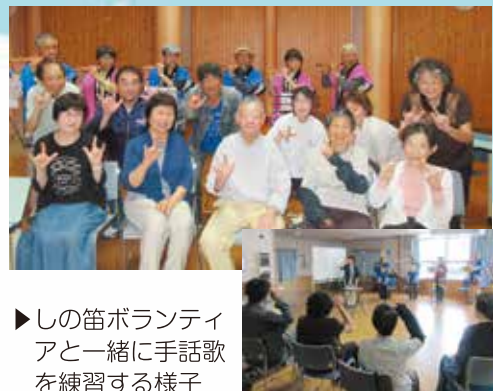
▶しの笛ボランティアと一緒に手話を練習する様子

手話のボランティアとして、長年活動を続けておられます。聴覚障がい者と支援者がともに活動することで、障がいの有無に関係なく共に生きることを実践されています。出前福祉講座では小学生への手話体験にも協力いただいています。関係者が集まって協議する場をつくり、より暮らしやすいまちづくりについても仲間と一緒に取り組まれています。